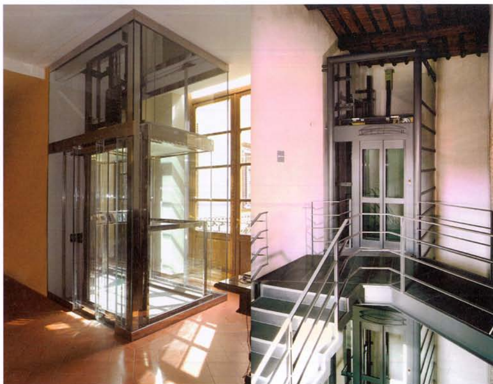
Sede Associazione Industriali di Lucca e Museo della Cattedrale di Lucca

Per valutare la situazione di rischio, sulla base delle norme di nuova tecnica più recenti, come UNI EN 81 – 80, il proprietario